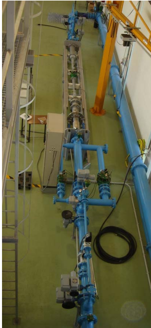
Figura 4 - Banco de pérdidas de carga y comprobación de los dispositivos de regulación

Hay que fomentar la comunicación entre los distintos comités de normalización que se ocupan de temas paralelos, para lograr esas normas “únicas” y mejorar las existentes incorporando las innovaciones tecnológicas que van apareciendo.