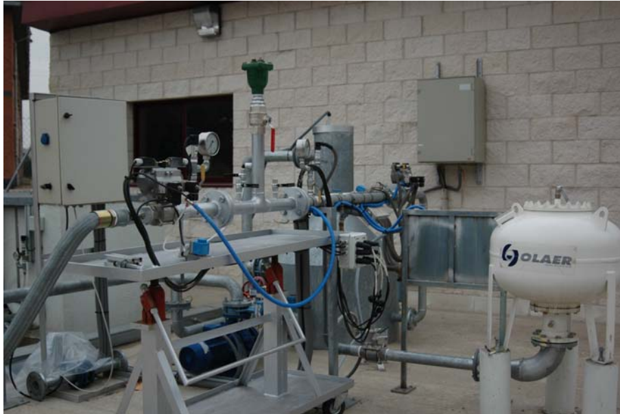
Figura 3 Banco de durabilidad Estático. Ensayo de Ventosas